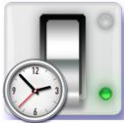
Rozliczenie czasu pracy